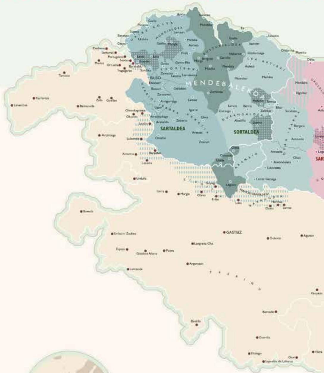
Euskararen eremuaren mugak (1850-1870-eko mapa (L.-L. Bonaparte))